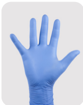
Gants en caoutchouc